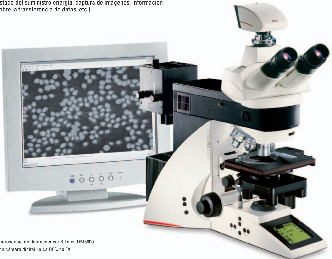
Microscopio de fluorescencia B Leica DM5000 con cámara digital Leica DFC340 FX

El software de la cámara hace de la grabación digital en pantalla un proceso rápido y fácil, tanto para PC como para MAC. La interfaz de fácil manejo está especialmente diseñada para su utilización en aplicaciones de microscopía. Las numerosas e intuitivas funciones de captura de imagen y edición que incorpora garantizan que las imágenes grabadas estén disponibles inmediatamente para visualizarse y continuar procesándose, lo cual proporciona la mayor calidad y todos los beneficios de la tecnología digital.