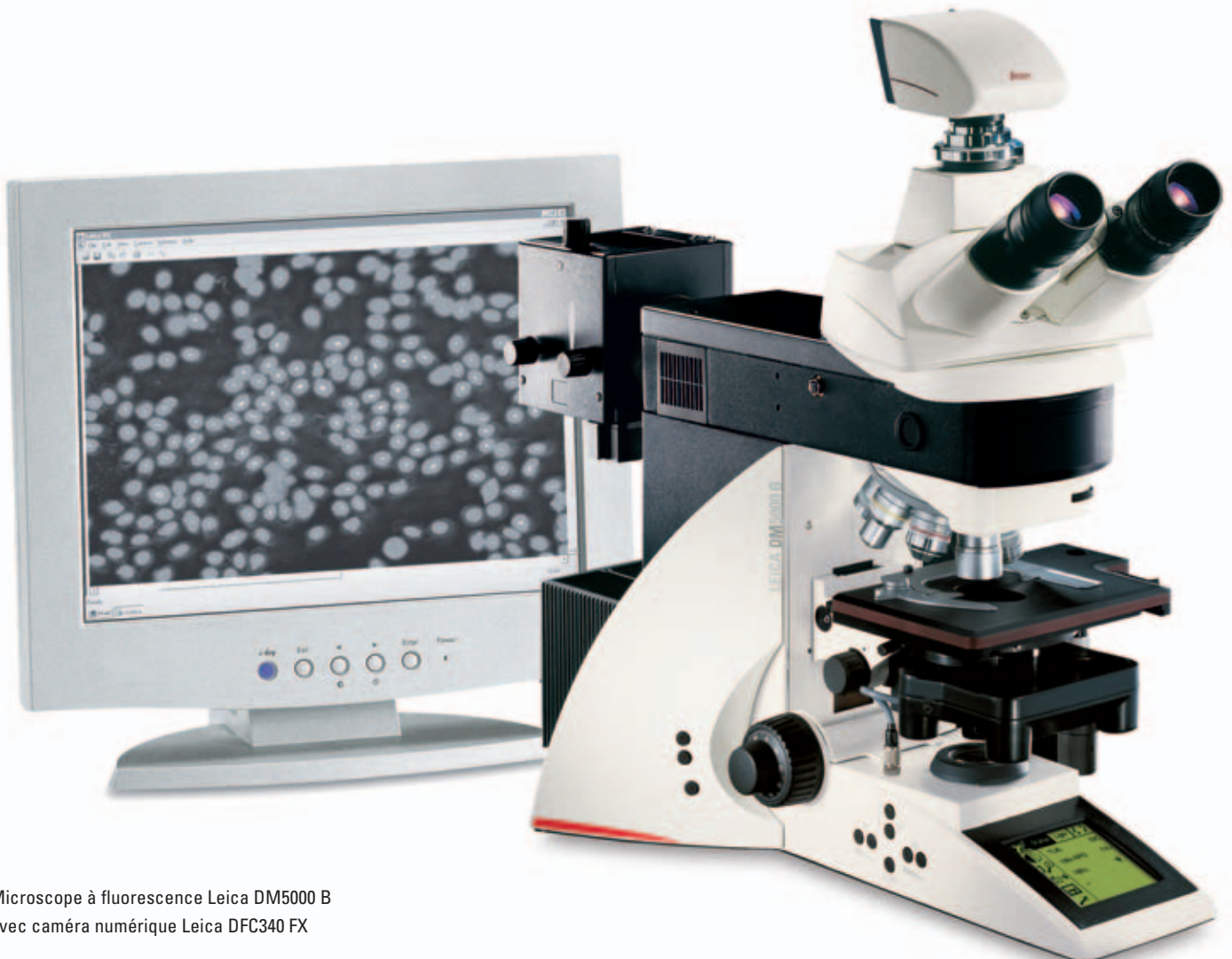
Microscope à fluorescence Leica DM5000 B avec caméra numérique Leica DFC340 FX

Le logiciel de la caméra permet de faire facilement et rapidement un enregistrement numérique de l'image affichée à l'écran, que ce soit avec un PC ou un MAC. L'interface facile à utiliser a été spécialement conçue pour les applications microscopiques. Grâce aux nombreuses fonctions intuitives de capture et d'édition d'images, les images enregistrées sont immédiatement disponibles pour la visualisation et le traitement ultérieur, offrant une très grande qualité et tous les avantages de la technologie numérique.