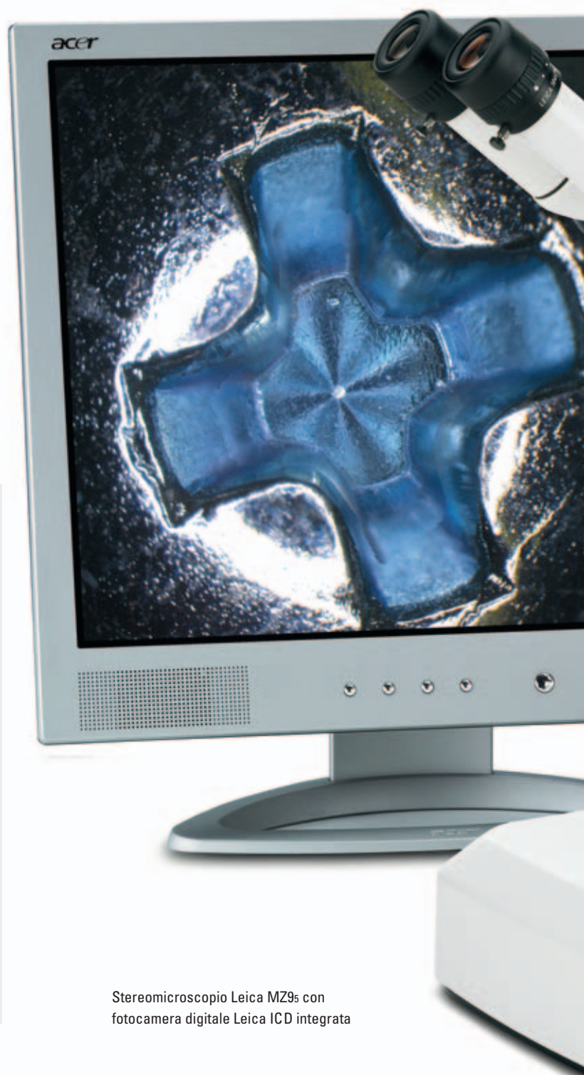
Stereomicroscopio Leica MZ9s con fotocamera digitale Leica ICD integrata