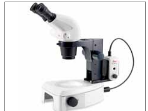
Adattatore per utilizzo della KL200 LED con stereomicroscopi serie S