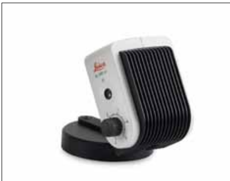
Versione stand-alone per montaggio della KL200 LED