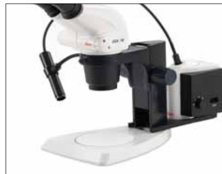
Conduttori a fibre ottiche universali con lenti integrate, per offrire un'emissione luminosa focalizzata.