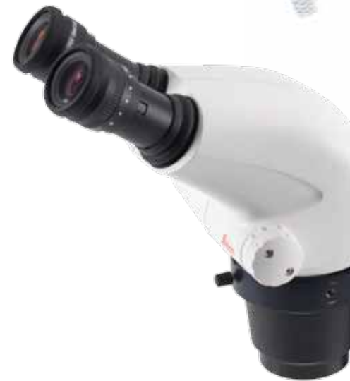
StereoZoom® Leica S6 E con sorgente a luce fredda Leica KL200 LED

La KL 200 LED offre un funzionamento semplice, unito a un eccellente ritorno dell'investimento.