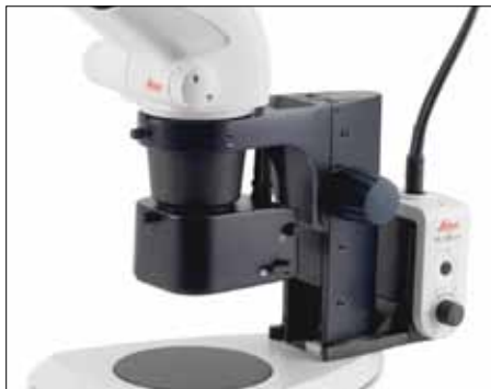
Illuminazione coassiale per oggetti riflettenti piani, quali ad esempio componenti metallici lucidi, wafer, chip o superfici stratificate