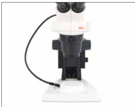
Base a luce trasmessa per vetrini preparati o campioni semitrasparenti.