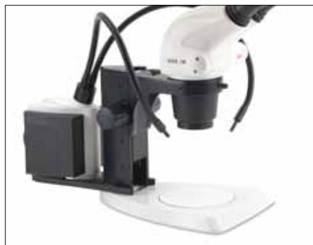
I doppi colli di cigno offrono la massima flessibilità per l'illuminazione di campioni impegnativi.