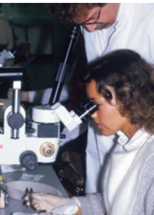
Leica M651, instrument pour travaux pratiques