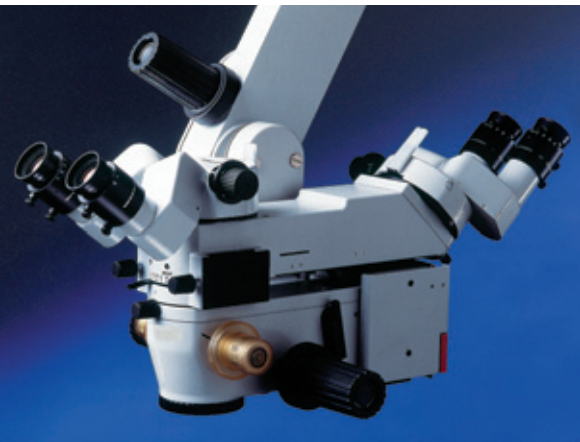
Leica M651, avec dispositif d'observation 180° pour assistant