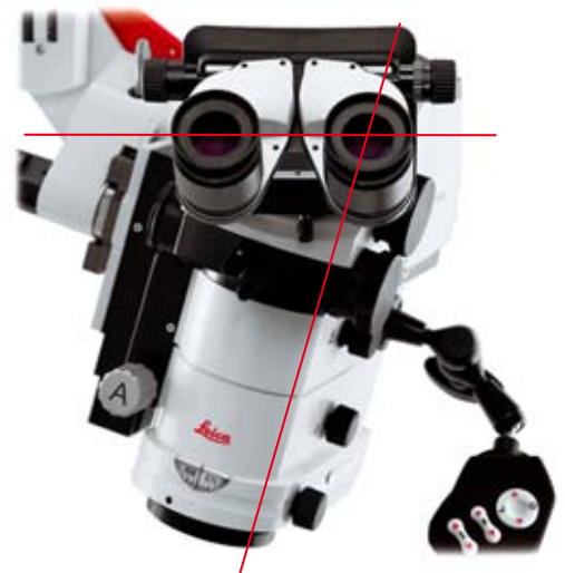
Leica M520 mit Leica DI C500 oder Leica Ultra Observer, ergonomische Horizontalposition des Tubus trotz schräg stehenden Optikträgers