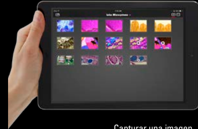
Capturar una imagen