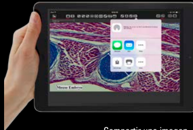
Compartir una imagen