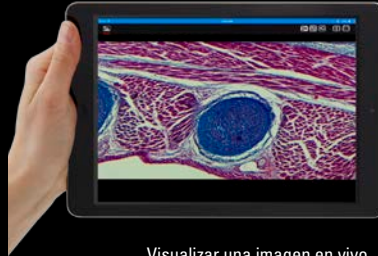
Visualizar una imagen en vivo

Con el control de pantalla táctil intuitivo, los estudiantes pueden medir, hacer anotaciones y archivar imágenes. Y lo mejor de todo: pueden compartir los resultados de trabajo con unos pocos clicks.