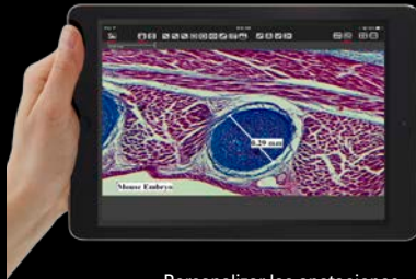
Personalizar las anotaciones