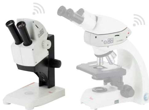
Leica EZ4 W